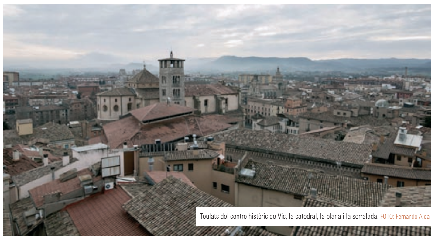
Teulats del centre històric de Vic, la catedral, la plana i la serralada.

Arquitectures on les relacions vinculades amb l'habitabilitat i establertes entre els seus diferents elements